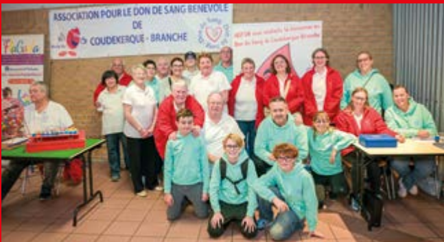
Toujours prêts à donner un coud'main aux associations, les lotos font salles pleines ! Merci aux assos Les Creules Côté et Flagada.