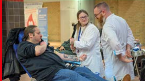
Pour sauver des vies, les Coudekerquois sont venus nombreux à la collecte de dons du sang.