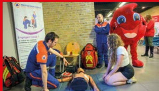
Les donneurs de sang bénévoles ont animé le Forum santé prévention, Coudekerque, Ville santé !