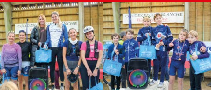
Bravo aux récompensés du run and bike par le Skwal athlon à la ferme Vernaelde.