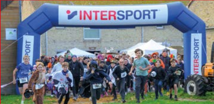
La terrifiante Monster Run de l'association ViRevolte a reçu le soutien des sportifs.