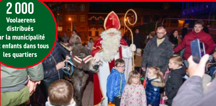
Enfants et parents se sont réunies autour de St Martin et de son âne pour un défilé sous la lumière des lanternes.

Voalærens distribués par la municipalité aux enfants dans tous les quartiers